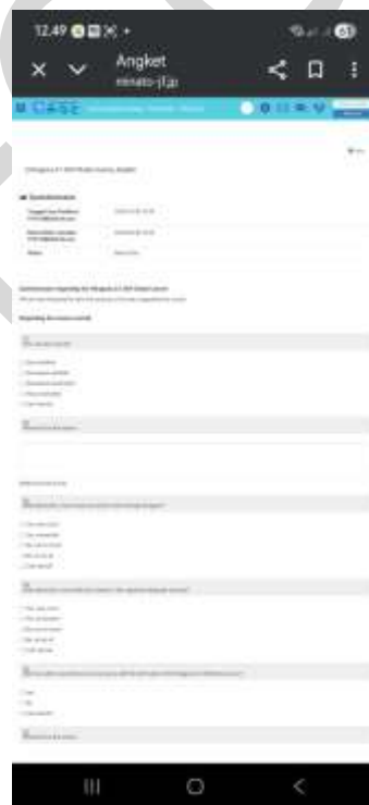
Gambar 3. Tangkapan layar lembar angket evaluasi