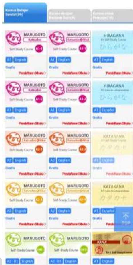
Gambar 1. Tangkapan layar kursus JF E-Learning Minato