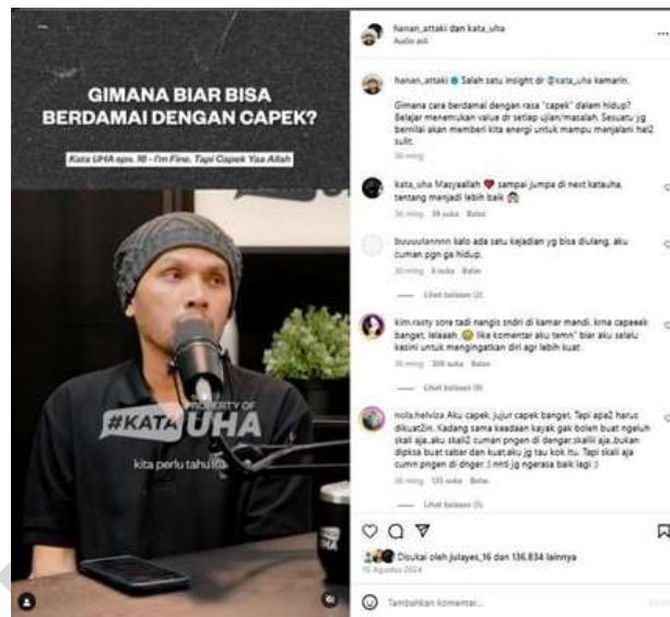
Gambar 2. Konten 1

Untuk menjawab tujuan penelitian, peneliti menganalisis sebanyak sepuluh konten dakwah dalam bentuk video reels yang diunggah pada periode 2024 hingga Februari 2025. Pemilihan konten didasarkan pada jumlah penonton ( viewers ) terbanyak, karena dianggap merepresentasikan pesan dakwah yang paling banyak dikonsumsi dan diterima oleh audiens. Penelitian dilakukan melalui observasi daring terhadap setiap konten, kemudian dilanjutkan dengan proses analisis menggunakan teknik pengkodean ( coding ) untuk mengidentifikasi makna, tema, serta pola framing pesan dakwah yang disampaikan. Hasil analisis tersebut disusun dalam bentuk tabel untuk mempermudah proses kategorisasi dan interpretasi data.