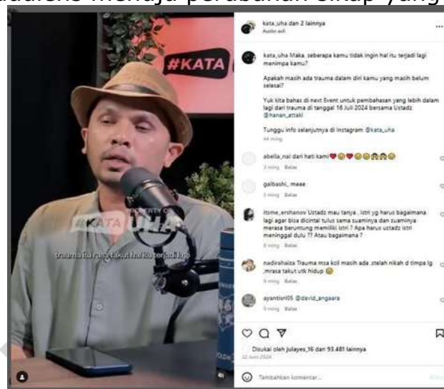
Gambar 5. Konten 4

Dari konten ini, peneliti memahami bahwa pesan dakwah yang disampaikan sangat dekat dengan problematika kehidupan remaja, yang umumnya rentan mengalami konflik emosional akibat percintaan. Melalui pendekatan persuasif, Ustaz Hanan Attaki tidak hanya memberikan nasihat, tetapi juga mengajak audiens untuk merefleksikan kembali makna cinta dalam perspektif keimanan. Menurut Anderson, komunikasi persuasif bertujuan untuk mengubah sikap, keyakinan, dan perilaku individu atau kelompok (Mirawati, 2021). Dalam konteks dakwah, komunikasi persuasif menjadi bagian penting karena dakwah pada hakikatnya bertujuan untuk mengajak dan membimbing audiens menuju perubahan sikap yang lebih baik.