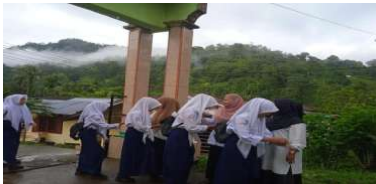
Gambar 3. Pembiasaan kedisiplinan di gerbang sekolah SMPN 5 Koto XI Tarusan

Dengan demikian, pembiasaan yang dilakukan secara berkelanjutan menjadi strategi efektif dalam menanamkan karakter tanggung jawab. Melalui praktik yang berulang, siswa belajar memahami aturan dan kewajiban, sehingga nilai disiplin yang terbentuk dapat menjadi dasar pengembangan tanggung jawab secara berkelanjutan.