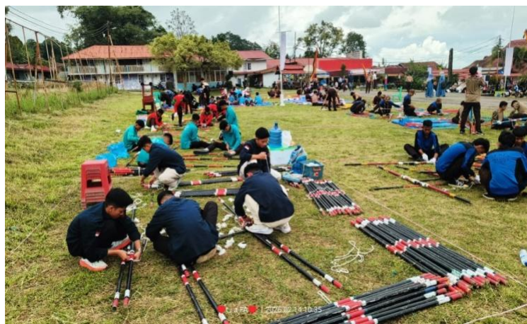
Gambar 6. Kegiatan Lomba Pramuka yang diadakan oleh Sekolah

Lingkungan yang terbuka membantu siswa menghindari sikap eksklusif dengan membiarkan mereka menyatakan keluhan dan pendapat mereka tanpa takut. Kemudian berdasarkan observasi yang dilakukan peneliti pihak sekolah menunjukkan keterbukaan lingkungan sekolah dengan mengadakan kegiatan yang melibatkan pihak luar ssekolah. Salah satunya yaitu sekolah mengadakan kegiatan lomba pramuka yang diselenggarakan di sekolah SMAS Nurul Ikhlas X Koto, Kabupaten Tanah Datar dengan mengundang siswa dari berbagai sekolah tanpa membatasi latar belakang sekolah. Hal ini menunjukkan bahwasanya pihak sekolah memanglah memberikan dukungan dalam pencegahan radikalisme melalui salah satunya yaitu keterbukaan lingkungan sekolah.