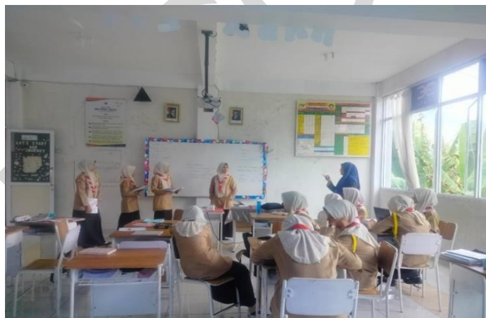
Gambar 3. Guru PPKn Mengajar dengan Menghargai Pendapat Siswa

Berdasarkan hasil observasi yang dilakukan oleh peneliti bahwasanya guru PPKn di dalam kelas selalu menghargai setiap pendapat siswa secara proposional. Guru PPKn tidak mengajarkan siswa untuk saling menyalahkan pendapat teman-temannya, tetapi guru mengajarkan siswa untuk mendengarkan pendapat dari teman nya terlebih dahulu dan jikalau ada yang tidak sesuai maka guru akan mengarahkan siswa supaya diskusi tetap berjalan dengan baik. Begitupun dengan siswa yang lainnya, boleh memberikan masukan kepada temannya, tetapi tetap dengan bahasa yang baik dan tidak menyakiti teman yang berpendapat. guru PPKn selalu mengajarkan penting nya menghargai sesama dan memberikan peluang kepada siswa untuk mengemukakan pendapat mereka masing-masing dengan teratur dan tidak menyalahkan argumen dari teman nya yang lain.