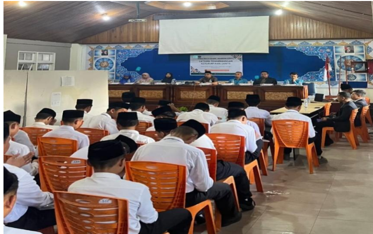
Gambar 7. Kegiatan Pelatihan Kepemimpinan Siswa