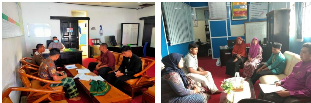
Gambar 8. Rapat Alumni dan Wali Murid