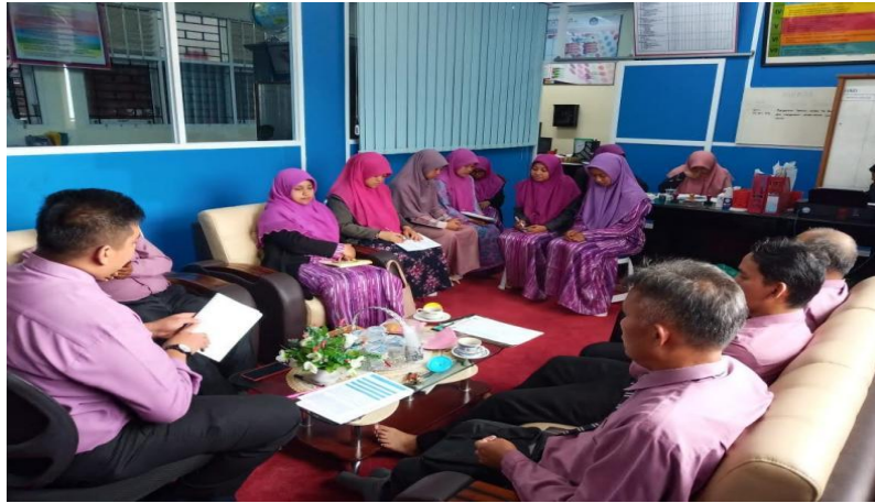
Gambar 9. Rapat Guru SMAS Nurul Ikhlas X Koto, Kabupaten Tanah Datar

Dengan adanya kerja sama antara guru, wali kelas dan pihak sekolah juga dapat membantu menciptakan lingkungan pendidikan yang baik. Keempat komponen ini menunjukkan bahwa pencegahan radikalisme di SMAS Nurul Ikhlas X Koto tidak hanya dilakukan melalui kegiatan pembelajaran. Ada juga beberapa faktor yang menjadi pendukung dari pencegahan ini yaitu adanya sistem sosial sekolah yang terbuka, hubungan yang harmonis, dan kerja sama dengan berbagai pihak. Lingkungan seperti inilah yang menjadi benteng yang kuat bagi siswa agar tidak mudah terpengaruh oleh nilai-nilai nasional.