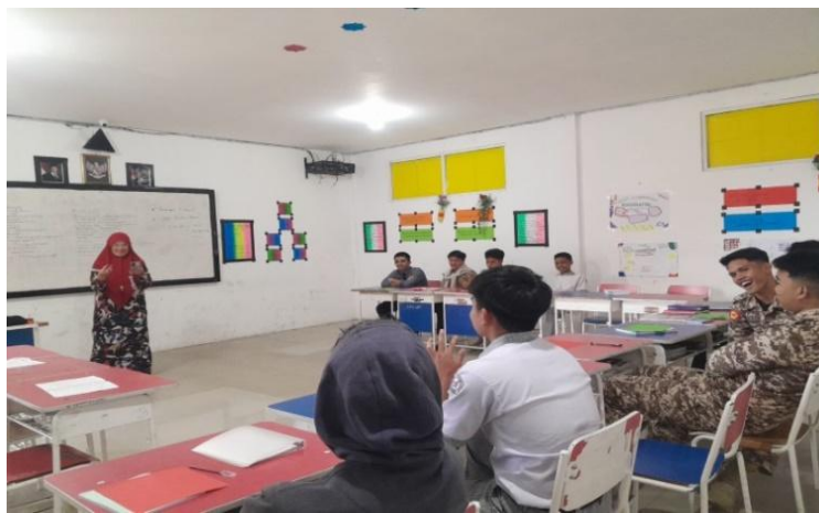
Gambar 1. Guru PPKn Mengajar di Kelas

Berdasarkan hasil observasi yang dilakukan oleh peneliti terlihat bahwa guru memperlakukan siswa secara adil dengan memberikan kesempatan kepada siswa untuk menyampaikan pendapat, menanggapi pendapat teman dan menyelesaikan perbedaan melalui diskusi dan musyawarah, hal ini menunjukkan bahwa siswa telah memperoleh sikap demokratis dan keterbukaan berpikir sebagai hasil dari pembelajaran PPKn. Hal ini juga sesuai dengan teori pembelajaran nilai, yang menekankan betapa pentingnya internalisasi nilai melalui pengalaman belajar yang signifikan.