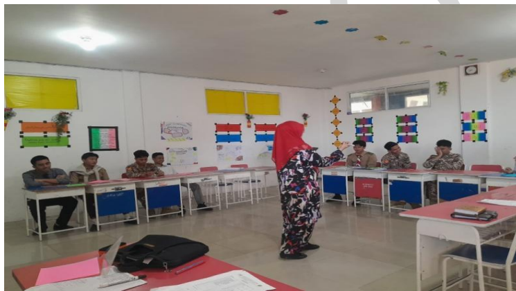
Gambar 5. Guru PPKn Menjelaskan materi di dalam Kelas

Hal ini dilakukan untuk mencegah terbentuknya kelompok eksklusif di sekolah. Kesamaan pendapat dapat mempersulit interaksi sosial dan memperkuat keyakinan sepihak. Ketertarikan pada kelompok tertutup adalah salah satu tanda kerentanan radikalisasi pada aspek sosial menurut teori (Schröder dkk., 2022). Oleh karena itu, guru berusaha untuk memfasilitasi interaksi yang beragam agar siswa terbiasa dengan perbedaan.